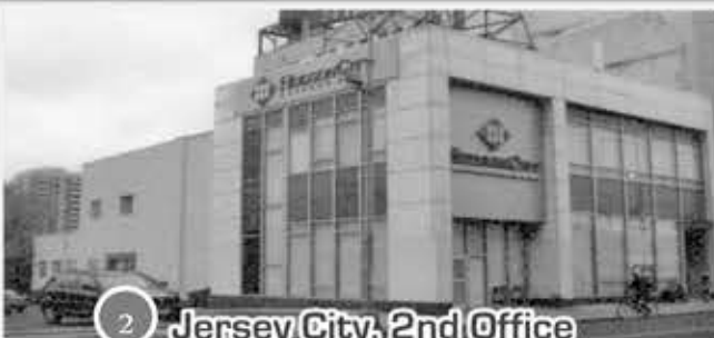
2 Jersey City, 2nd Office 587 Summit Ave., Hudson City Savings Bldg, JC NJ 07306 Tel.: 201-420-0001 / Corner of Summit & Cottage