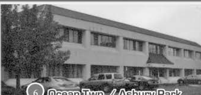
6 Ocean Twp. / Asbury Park 1500 Allaire Ave., Suite 103, Ocean, NJ 07503 Tel.: 732-660-6798