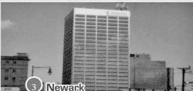
3 Newark One Gateway Center, Suite 2600 - 26th FL., Newark JC NJ 07102 - Tel.: 973-653-3945