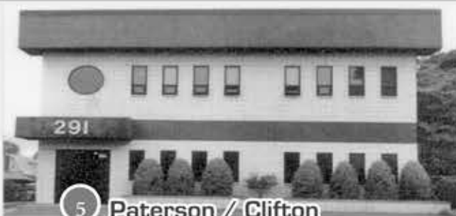
5 Paterson / Clifton 291 Crooks Ave., 2nd FL., Paterson, NJ 07503 Tel.: 973-653-3945