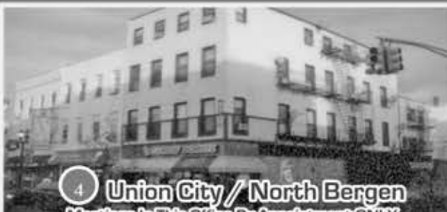
4 Union City / North Bergen Meetings In This Office By Appointment ONLY 418 Monastery Place, Union City, NJ 07087 Tel.: 201-420-0001