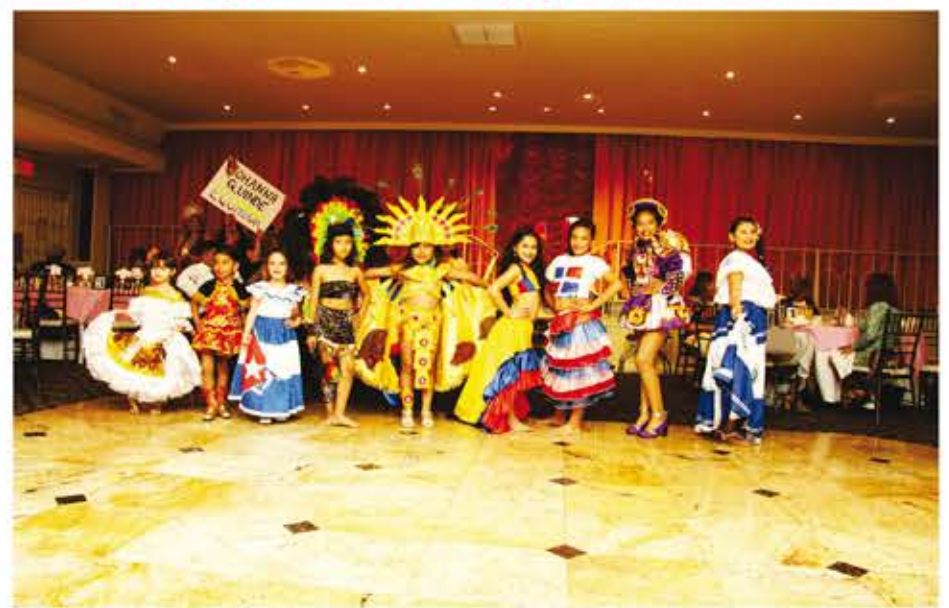
• Las candidatas a Miss Chiquitica 2018 se presentaron en trajes típicos de sus países.