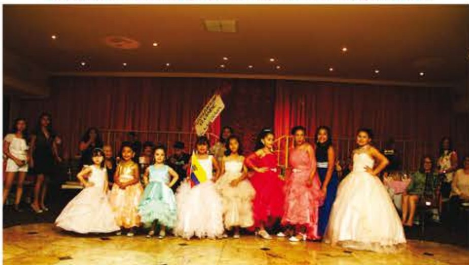
• Las candidatas a Miss Chiquitica 2018 se presentaron en trajes de gala.