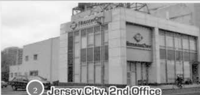
2 Jersey City, 2nd Office 587 Summit Ave., Hudson City Savings Bldg, JC NJ 07306 Tel.: 201-420-0001 / Corner of Summit & Cottage