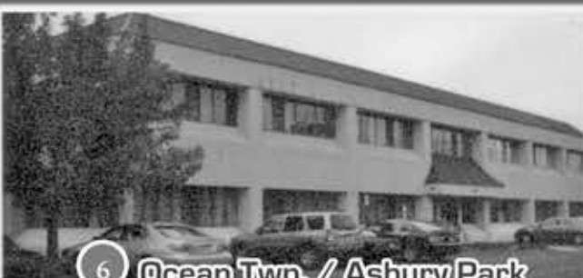
6 Ocean Twp. / Asbury Park 1500 Allaire Ave., Suite 103, Ocean, NJ 07503 Tel.: 732-660-6798