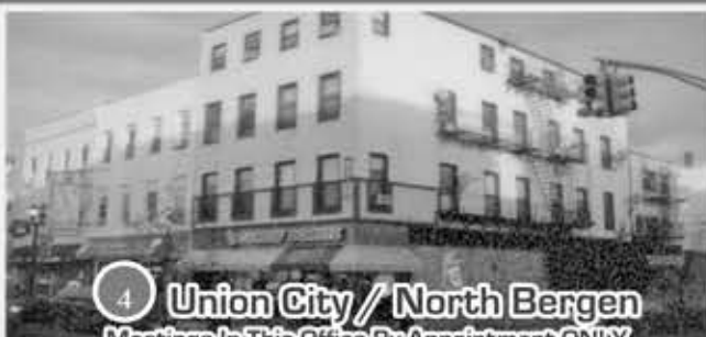
4 Union City / North Bergen Meetings In This Office By Appointment ONLY 418 Monastery Place, Union City, NJ 07087 Tel.: 201-420-0001