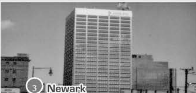
3 Newark One Gateway Center, Suite 2600 - 26th FL., Newark JC NJ 07102 - Tel.: 973-653-3945