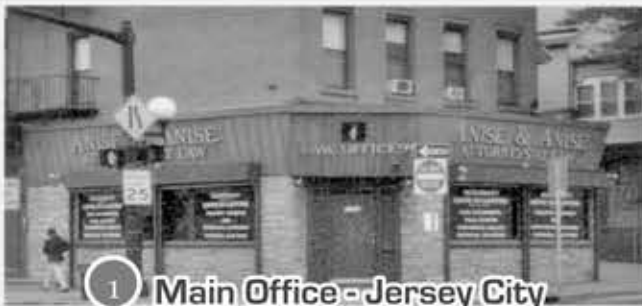
1 Main Office - Jersey City 2974 Kennedy Blvd. Jersey City, NJ 07306 Tel.: 201-420-0001 / Corner of Kennedy & Cottage