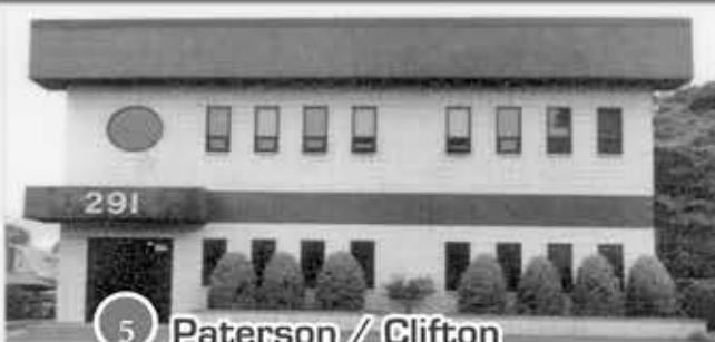
5 Paterson / Clifton 291 Crooks Ave., 2nd FL., Paterson, NJ 07503 Tel.: 973-653-3945