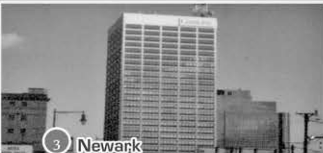
3 Newark One Gateway Center, Suite 2600 - 26th FL., Newark JC NJ 07102 - Tel.: 973-653-3945