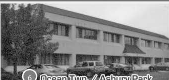
6 Ocean Twp. / Asbury Park 1500 Allaire Ave., Suite 103, Ocean, NJ 07503 Tel.: 732-660-6798