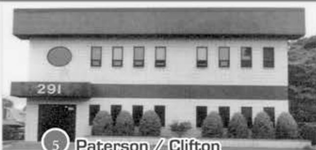
5 Paterson / Clifton 291 Crooks Ave., 2nd FL., Paterson, NJ 07503 Tel.: 973-653-3945