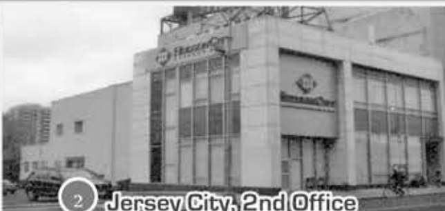
2 Jersey City, 2nd Office 587 Summit Ave., Hudson City Savings Bldg, JC NJ 07306 Tel.: 201-420-0001 / Corner of Summit & Cottage