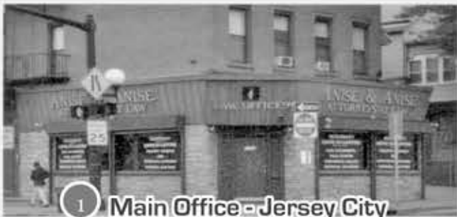
1 Main Office - Jersey City 2974 Kennedy Blvd. Jersey City, NJ 07306 Tel.: 201-420-0001 / Corner of Kennedy & Cottage