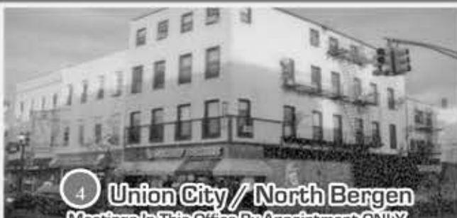
4 Union City / North Bergen Meetings In This Office By Appointment ONLY 418 Monastery Place, Union City, NJ 07087 Tel.: 201-420-0001