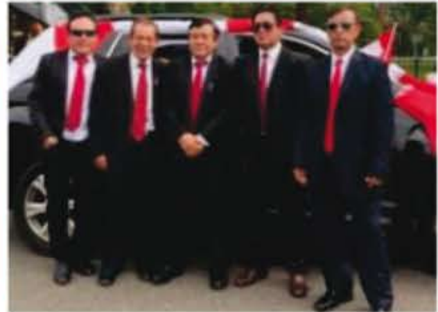
Peruanos Unidos en NJ. Inc.