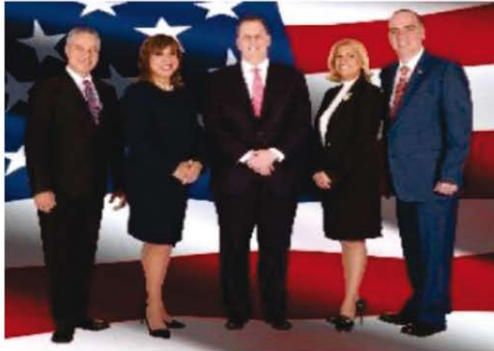
Mayor & Commissioners