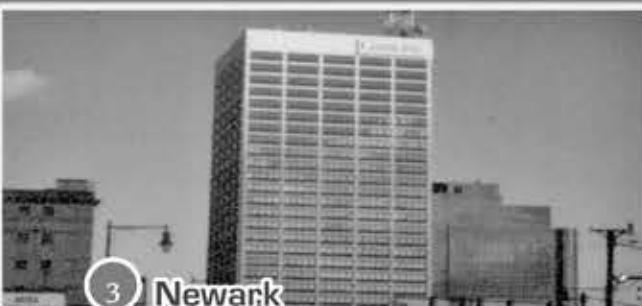
3 Newark One Gateway Center, Suite 2600 - 26th FL., Newark JC NJ 07102 - Tel.: 973-653-3945