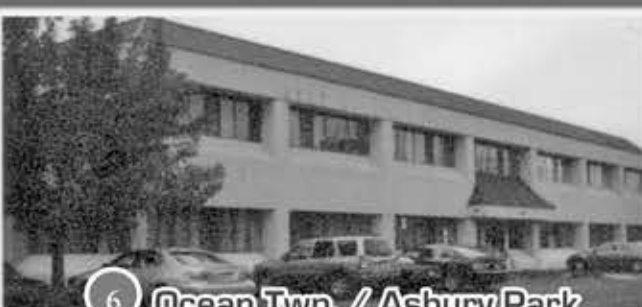
6 Ocean Twp. / Asbury Park 1500 Allaire Ave., Suite 103, Ocean, NJ 07503 Tel.: 732-660-6798