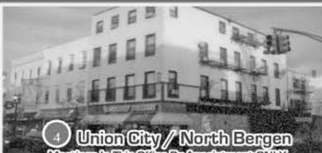
4 Union City / North Bergen Meetings In This Office By Appointment ONLY 418 Monastery Place, Union City, NJ 07087 Tel.: 201-420-0001