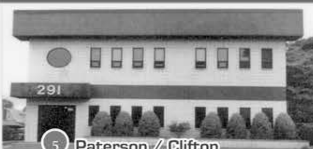
5 Paterson / Clifton 291 Crooks Ave., 2nd FL., Paterson, NJ 07503 Tel.: 973-653-3945