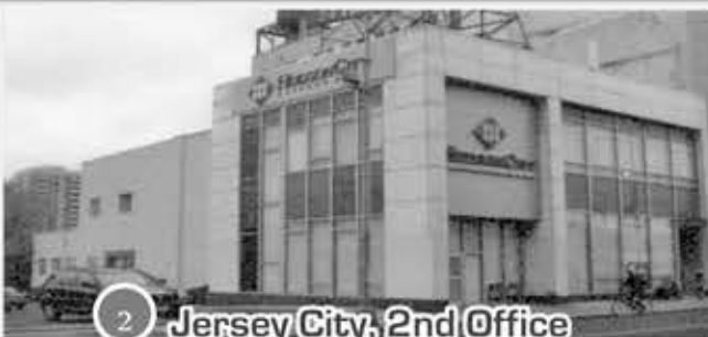
2 Jersey City, 2nd Office 587 Summit Ave., Hudson City Savings Bldg, JC NJ 07306 Tel.: 201-420-0001 / Corner of Summit & Cottage