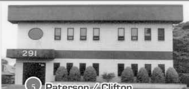
5 Paterson / Clifton 291 Crooks Ave., 2nd FL., Paterson, NJ 07503 Tel.: 973-653-3945