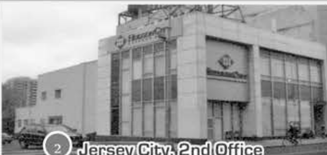
2 Jersey City, 2nd Office 587 Summit Ave., Hudson City Savings Bldg, JC NJ 07306 Tel.: 201-420-0001 / Corner of Summit & Cottage