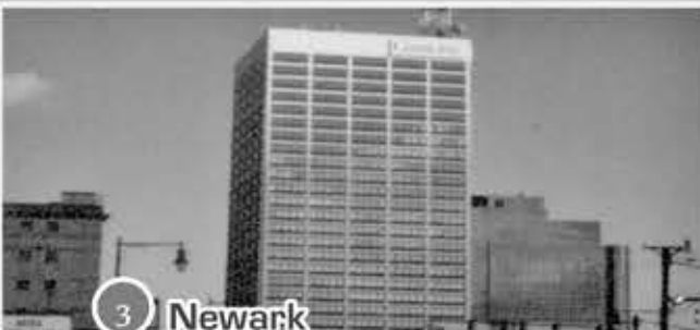
3 Newark One Gateway Center, Suite 2600 - 26th FL., Newark JC NJ 07102 - Tel.: 973-653-3945