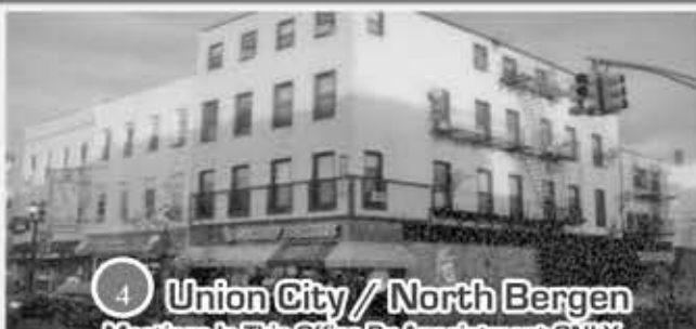
4 Union City / North Bergen Meetings In This Office By Appointment ONLY 418 Monastery Place, Union City, NJ 07087 Tel.: 201-420-0001