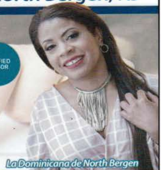
La Dominicana de North Bergen

Taxes ♦ Contabilidad ♦ Nóminas ♦ Incorporaciones ♦ Número ITIN