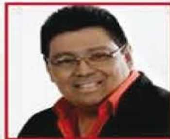
Edgar Zapata "El Sonero de Paterson"