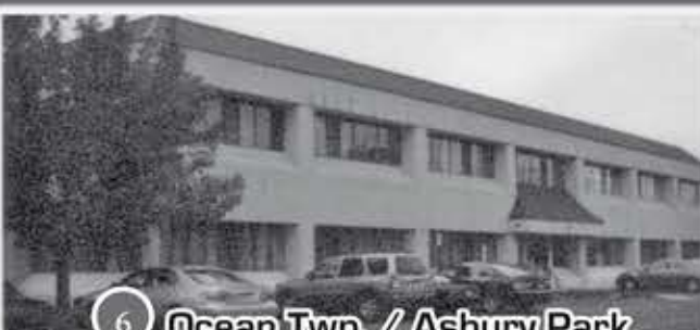
6 Ocean Twp. / Asbury Park 1500 Allaire Ave., Suite 103, Ocean, NJ 07503 Tel.: 732-660-6798