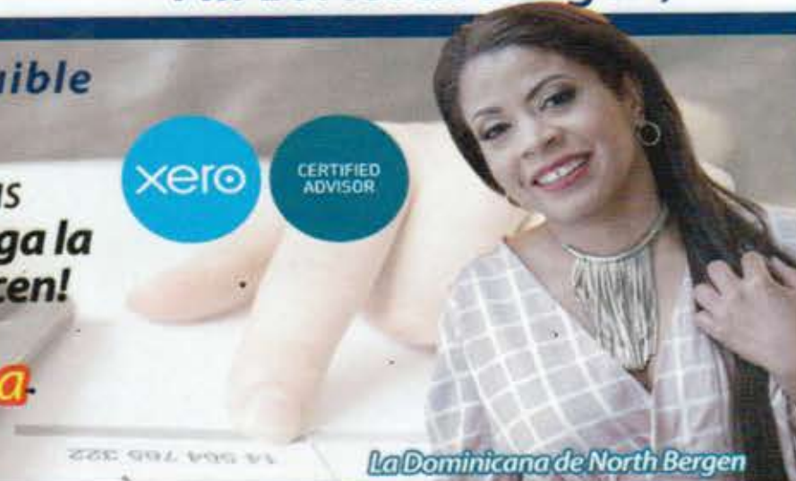
La Dominicana de North Bergen

Taxes ♦ Contabilidad ♦ Nóminas ♦ Incorporaciones ♦ Número ITIN