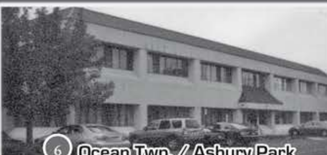
6 Ocean Twp. / Asbury Park 1500 Allaire Ave., Suite 103, Ocean, NJ 07503 Tel.: 732-660-6798