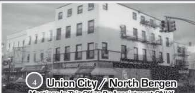
4 Union City / North Bergen Meetings In This Office By Appointment ONLY 418 Monastery Place, Union City, NJ 07087 Tel.: 201-420-0001