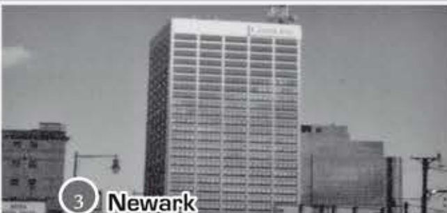
3 Newark One Gateway Center, Suite 2600 - 26th FL., Newark JC NJ 07102 - Tel.: 973-653-3945