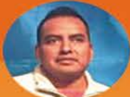
El Negro de Oro