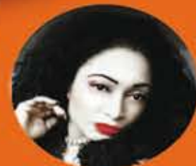
La Negra Chavelona