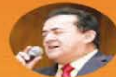
Holguer Vallejo (Embajador)