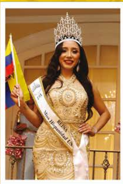
ALEJANDRA PALACIOS Miss Hispanidad USA 2018