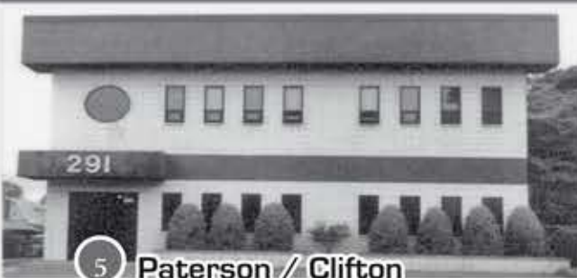
5 Paterson / Clifton 291 Crooks Ave., 2nd FL., Paterson, NJ 07503 Tel.: 973-653-3945