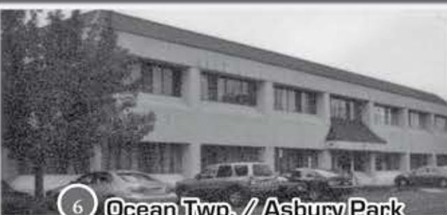
6 Ocean Twp. / Asbury Park 1500 Allaire Ave., Suite 103, Ocean, NJ 07503 Tel.: 732-660-6798