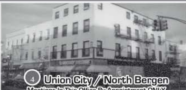
4 Union City / North Bergen Meetings In This Office By Appointment ONLY 418 Monastery Place, Union City, NJ 07087 Tel.: 201-420-0001