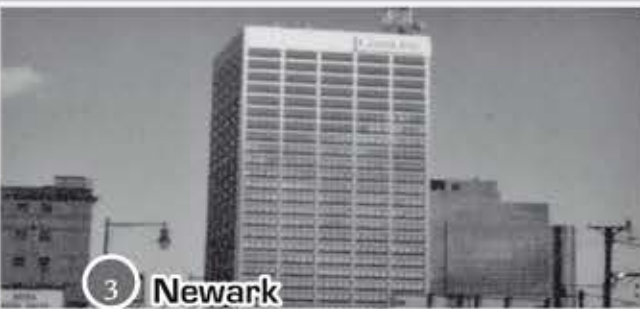
3 Newark One Gateway Center, Suite 2600 - 26th FL., Newark JC NJ 07102 - Tel.: 973-653-3945