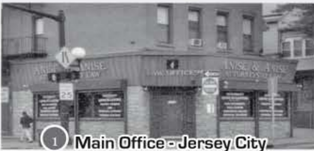
1 Main Office - Jersey City 2974 Kennedy Blvd. Jersey City, NJ 07306 Tel.: 201-420-0001 / Corner of Kennedy & Cottage