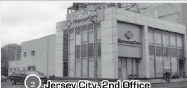
2 Jersey City, 2nd Office 587 Summit Ave., Hudson City Savings Bldg, JC NJ 07306 Tel.: 201-420-0001 / Corner of Summit & Cottage