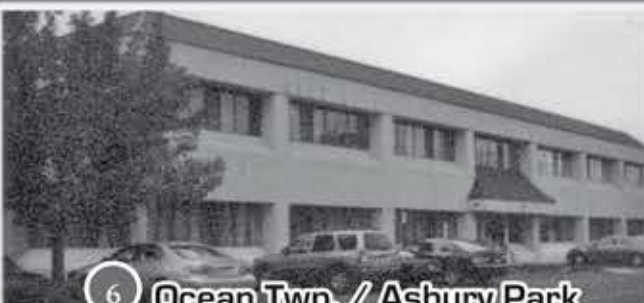
6 Ocean Twp. / Asbury Park 1500 Allaire Ave., Suite 103, Ocean, NJ 07503 Tel.: 732-660-6798