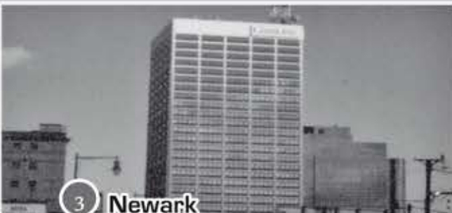
3 Newark One Gateway Center, Suite 2600 - 26th FL., Newark JC NJ 07102 - Tel.: 973-653-3945