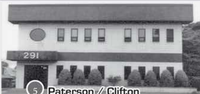
5 Paterson / Clifton 291 Crooks Ave., 2nd FL., Paterson, NJ 07503 Tel.: 973-653-3945