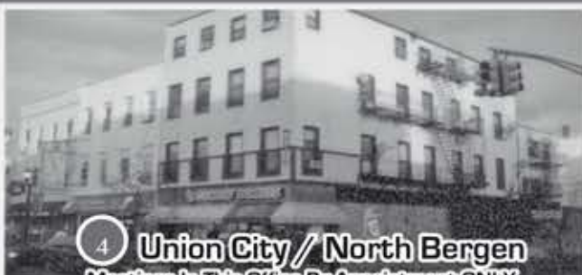
4 Union City / North Bergen Meetings In This Office By Appointment ONLY 418 Monastery Place, Union City, NJ 07087 Tel.: 201-420-0001