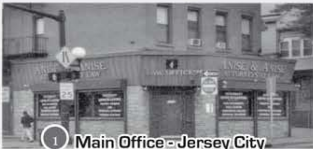
1 Main Office - Jersey City 2974 Kennedy Blvd. Jersey City, NJ 07306 Tel.: 201-420-0001 / Corner of Kennedy & Cottage