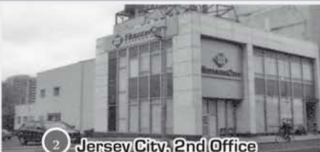
2 Jersey City, 2nd Office 587 Summit Ave., Hudson City Savings Bldg, JC NJ 07306 Tel.: 201-420-0001 / Corner of Summit & Cottage