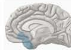
Enfermedad de Alzheimer muy temprana

Los problemas de la memoria son una de las primeras señales del Alzheimer. Algunas personas que tienen problemas de la memoria tienen una condición llamada deterioro cognitivo leve de tipo amnésico (DCL o MCI en inglés). Las personas afectadas con este deterioro tienen más problemas de los que normalmente tienen las personas de su misma edad, pero sus síntomas no son tan severos como los de aquellas que tienen la enfermedad. Cuando son comparadas con personas que no tienen DCL, la mayoría de las personas que sí lo tienen terminan desarrollando el Alzheimer. Otros cambios también pueden ser señal de las etapas muy tempranas de la enfermedad. Por ejemplo, imágenes del cerebro y estudios de marcadores biológicos de personas que tienen DCL y de personas que tienen un historial familiar de padecimiento de Alzheimer, han empezado a detectar cambios tempranos en el cerebro que son similares a los encontrados en esta enfermedad.