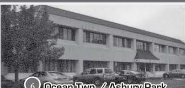
6 Ocean Twp. / Asbury Park 1500 Allaire Ave., Suite 103, Ocean, NJ 07503 Tel.: 732-660-6798