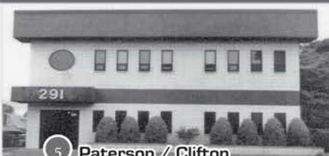
5 Paterson / Clifton 291 Crooks Ave., 2nd FL., Paterson, NJ 07503 Tel.: 973-653-3945