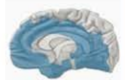
Enfermedad de Alzheimer severa