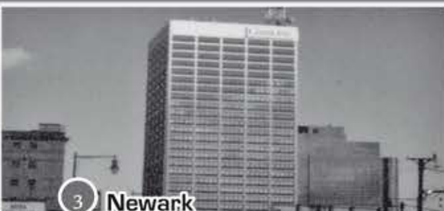
3 Newark One Gateway Center, Suite 2600 - 26th FL., Newark JC NJ 07102 - Tel.: 973-653-3945