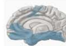
Enfermedad de Alzheimer leve a moderada