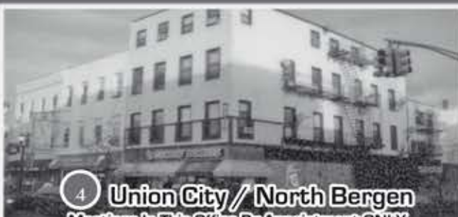
4 Union City / North Bergen Meetings In This Office By Appointment ONLY 418 Monastery Place, Union City, NJ 07087 Tel.: 201-420-0001