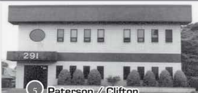
5 Paterson / Clifton 291 Crooks Ave., 2nd FL., Paterson, NJ 07503 Tel.: 973-653-3945