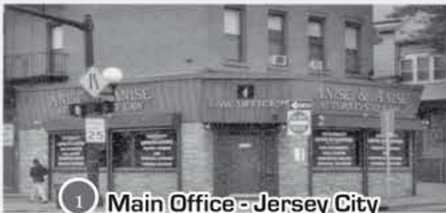
1 Main Office - Jersey City 2974 Kennedy Blvd. Jersey City, NJ 07306 Tel.: 201-420-0001 / Corner of Kennedy & Cottage