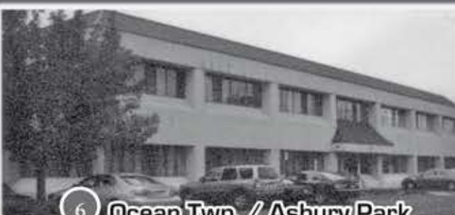
6 Ocean Twp. / Asbury Park 1500 Allaire Ave., Suite 103, Ocean, NJ 07503 Tel.: 732-660-6798