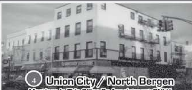
4 Union City / North Bergen Meetings In This Office By Appointment ONLY 418 Monastery Place, Union City, NJ 07087 Tel.: 201-420-0001