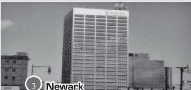
3 Newark One Gateway Center, Suite 2600 - 26th FL., Newark JC NJ 07102 - Tel.: 973-653-3945