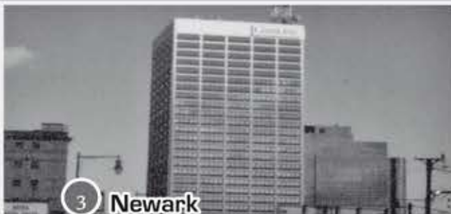
3 Newark One Gateway Center, Suite 2600 - 26th FL., Newark JC NJ 07102 - Tel.: 973-653-3945