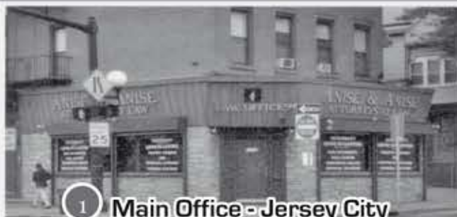
1 Main Office - Jersey City 2974 Kennedy Blvd. Jersey City, NJ 07306 Tel.: 201-420-0001 / Corner of Kennedy & Cottage