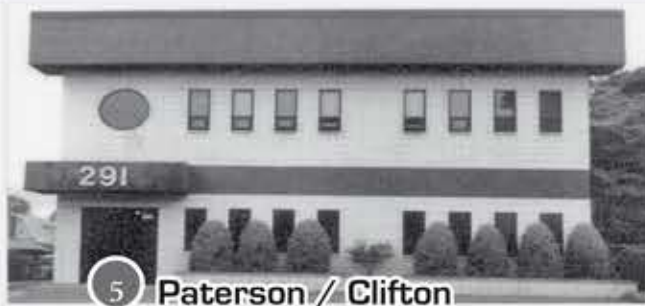
5 Paterson / Clifton 291 Crooks Ave., 2nd FL., Paterson, NJ 07503 Tel.: 973-653-3945