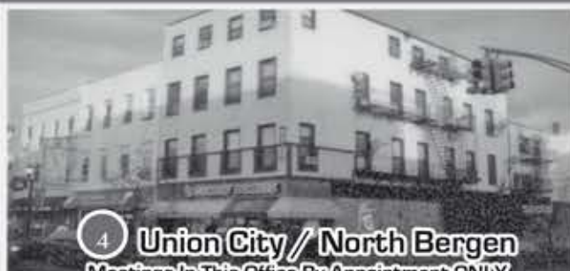
4 Union City / North Bergen Meetings In This Office By Appointment ONLY 418 Monastery Place, Union City, NJ 07087 Tel.: 201-420-0001