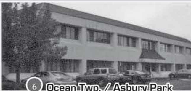
6 Ocean Twp. / Asbury Park 1500 Allaire Ave., Suite 103, Ocean, NJ 07503 Tel.: 732-660-6798