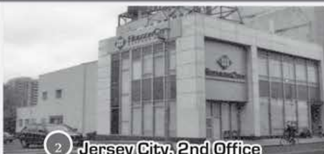
2 Jersey City, 2nd Office 587 Summit Ave., Hudson City Savings Bldg, JC NJ 07306 Tel.: 201-420-0001 / Corner of Summit & Cottage