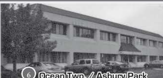
6 Ocean Twp. / Asbury Park 1500 Allaire Ave., Suite 103, Ocean, NJ 07503 Tel.: 732-660-6798