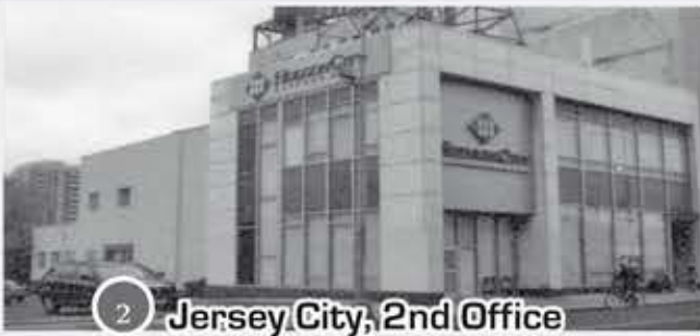
2 Jersey City, 2nd Office 587 Summit Ave., Hudson City Savings Bldg, JC NJ 07306 Tel.: 201-420-0001 / Corner of Summit & Cottage