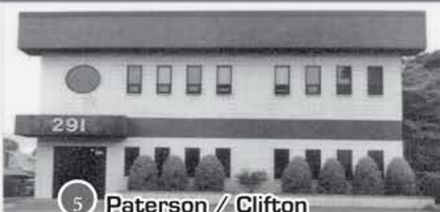
5 Paterson / Clifton 291 Crooks Ave., 2nd FL., Paterson, NJ 07503 Tel.: 973-653-3945