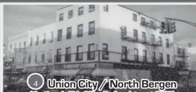
4 Union City / North Bergen Meetings In This Office By Appointment ONLY 418 Monastery Place, Union City, NJ 07087 Tel.: 201-420-0001