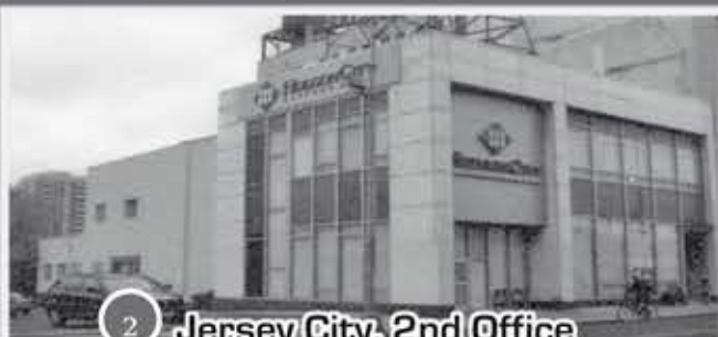
2 Jersey City, 2nd Office 587 Summit Ave., Hudson City Savings Bldg, JC NJ 07306 Tel.: 201-420-0001 / Corner of Summit & Cottage