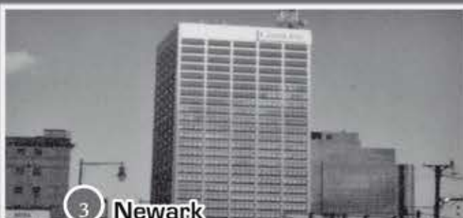
3 Newark One Gateway Center, Suite 2600 - 26th FL., Newark JC NJ 07102 - Tel.: 973-653-3945