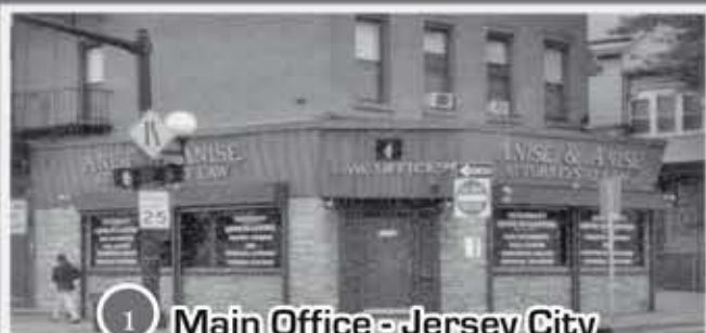
1 Main Office - Jersey City 2974 Kennedy Blvd. Jersey City, NJ 07306 Tel.: 201-420-0001 / Corner of Kennedy & Cottage