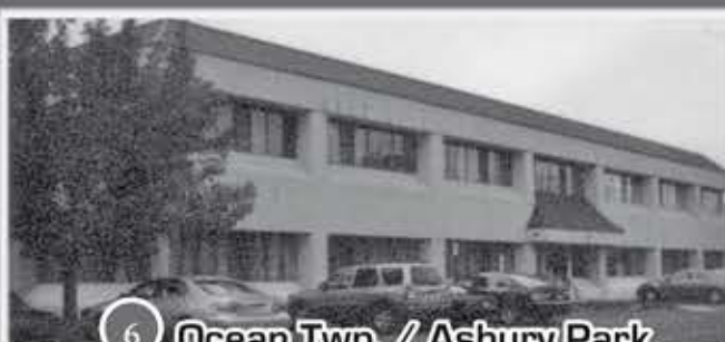
6 Ocean Twp. / Asbury Park 1500 Allaire Ave., Suite 103, Ocean, NJ 07503 Tel.: 732-660-6798