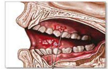
Úlceras en las membranas mucosas del interior de las mejillas y las encías

Cualquier persona puede desarrollar aftas. Las mujeres son más propensas a contraerlas que los hombres. Las aftas pueden ser hereditarias.