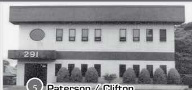
5 Paterson / Clifton 291 Crooks Ave., 2nd FL., Paterson, NJ 07503 Tel.: 973-653-3945