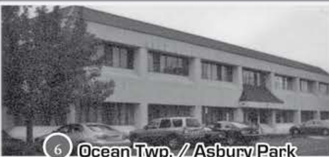
6 Ocean Twp. / Asbury Park 1500 Allaire Ave., Suite 103, Ocean, NJ 07503 Tel.: 732-660-6798