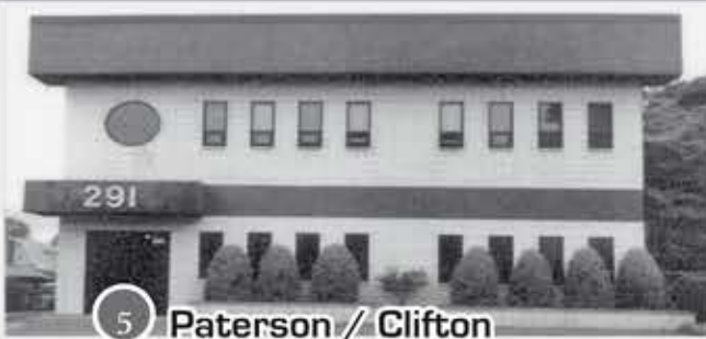
5 Paterson / Clifton 291 Crooks Ave., 2nd FL., Paterson, NJ 07503 Tel.: 973-653-3945