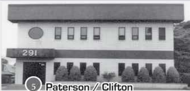
5 Paterson / Clifton 291 Crooks Ave., 2nd FL., Paterson, NJ 07503 Tel.: 973-653-3945