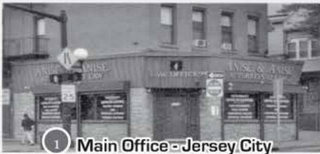
1 Main Office - Jersey City 2974 Kennedy Blvd. Jersey City, NJ 07306 Tel.: 201-420-0001 / Corner of Kennedy & Cottage