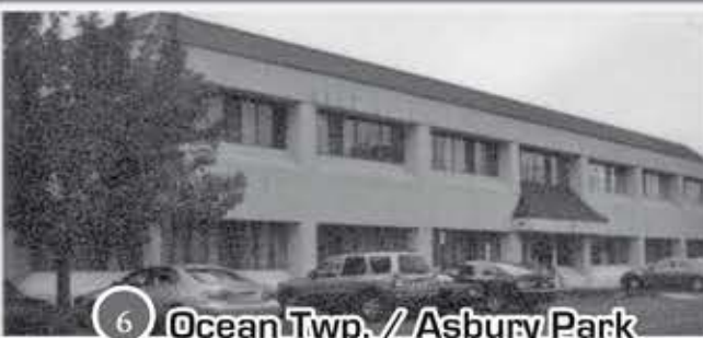
6 Ocean Twp. / Asbury Park 1500 Allaire Ave., Suite 103, Ocean, NJ 07503 Tel.: 732-660-6798