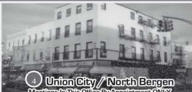
4 Union City / North Bergen Meetings In This Office By Appointment ONLY 418 Monastery Place, Union City, NJ 07087 Tel.: 201-420-0001