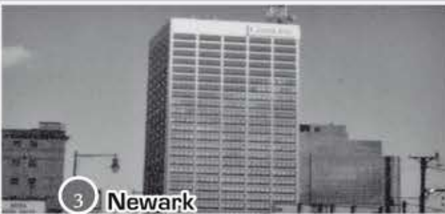
3 Newark One Gateway Center, Suite 2600 - 26th FL., Newark JC NJ 07102 - Tel.: 973-653-3945