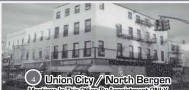
4 Union City / North Bergen Meetings In This Office By Appointment ONLY 418 Monastery Place, Union City, NJ 07087 Tel.: 201-420-0001