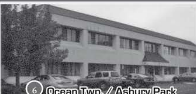
6 Ocean Twp. / Asbury Park 1500 Allaire Ave., Suite 103, Ocean, NJ 07503 Tel.: 732-660-6798