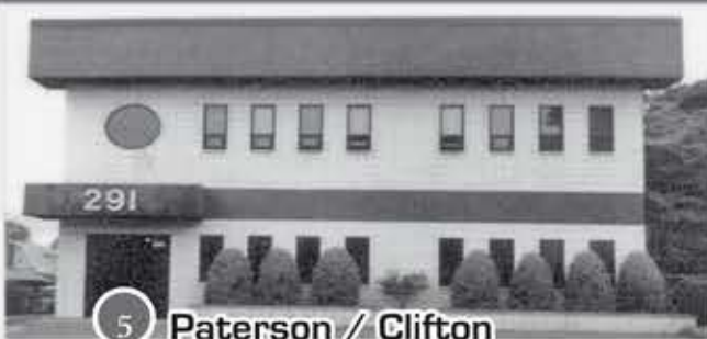
5 Paterson / Clifton 291 Crooks Ave., 2nd FL., Paterson, NJ 07503 Tel.: 973-653-3945