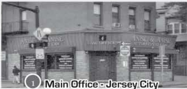
1 Main Office - Jersey City 2974 Kennedy Blvd. Jersey City, NJ 07306 Tel.: 201-420-0001 / Corner of Kennedy & Cottage