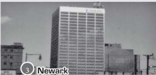
3 Newark One Gateway Center, Suite 2600 - 26th FL., Newark JC NJ 07102 - Tel.: 973-653-3945