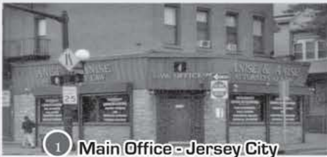
1 Main Office - Jersey City 2974 Kennedy Blvd. Jersey City, NJ 07306 Tel.: 201-420-0001 / Corner of Kennedy & Cottage