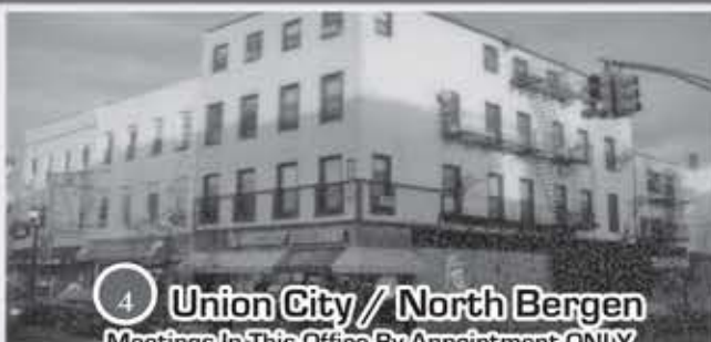
4 Union City / North Bergen Meetings In This Office By Appointment ONLY 418 Monastery Place, Union City, NJ 07087 Tel.: 201-420-0001