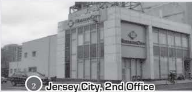
2 Jersey City, 2nd Office 587 Summit Ave., Hudson City Savings Bldg, JC NJ 07306 Tel.: 201-420-0001 / Corner of Summit & Cottage