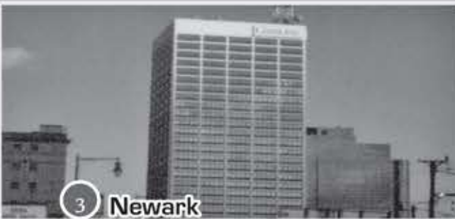
3 Newark One Gateway Center, Suite 2600 - 26th FL., Newark JC NJ 07102 - Tel.: 973-653-3945