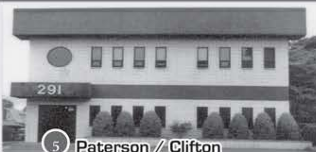
5 Paterson / Clifton 291 Crooks Ave., 2nd FL., Paterson, NJ 07503 Tel.: 973-653-3945