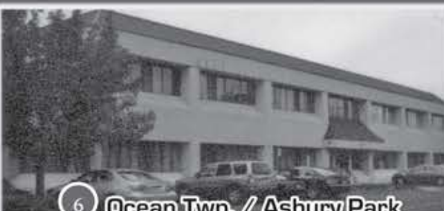
6 Ocean Twp. / Asbury Park 1500 Allaire Ave., Suite 103, Ocean, NJ 07503 Tel.: 732-660-6798