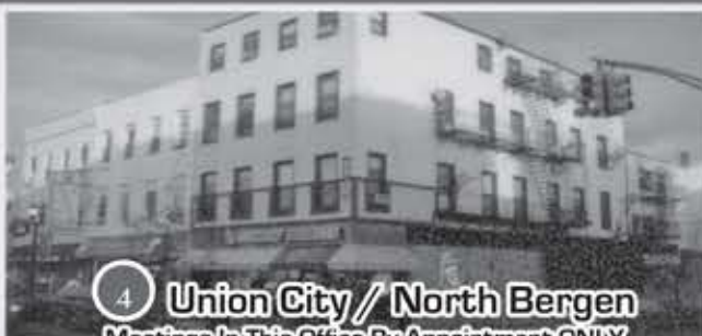
4 Union City / North Bergen Meetings In This Office By Appointment ONLY 418 Monastery Place, Union City, NJ 07087 Tel.: 201-420-0001