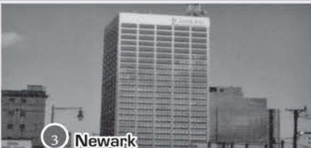
3 Newark One Gateway Center, Suite 2600 - 26th FL., Newark JC NJ 07102 - Tel.: 973-653-3945