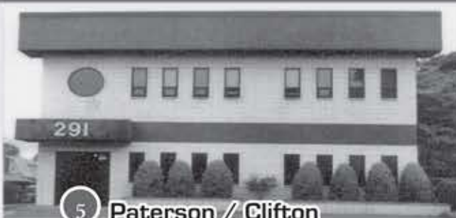
5 Paterson / Clifton 291 Crooks Ave., 2nd FL., Paterson, NJ 07503 Tel.: 973-653-3945