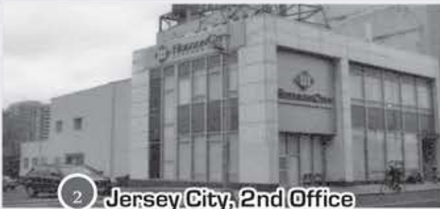
2 Jersey City, 2nd Office 587 Summit Ave., Hudson City Savings Bldg, JC NJ 07306 Tel.: 201-420-0001 / Corner of Summit & Cottage