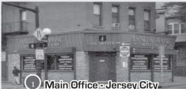
1 Main Office - Jersey City 2974 Kennedy Blvd. Jersey City, NJ 07306 Tel.: 201-420-0001 / Corner of Kennedy & Cottage