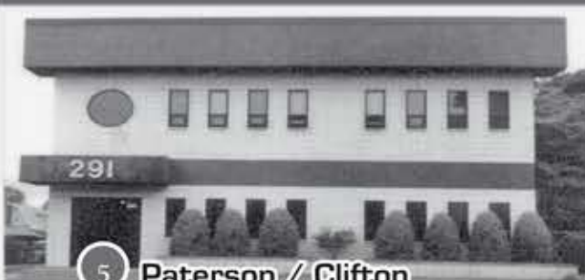
5 Paterson / Clifton 291 Crooks Ave., 2nd FL., Paterson, NJ 07503 Tel.: 973-653-3945