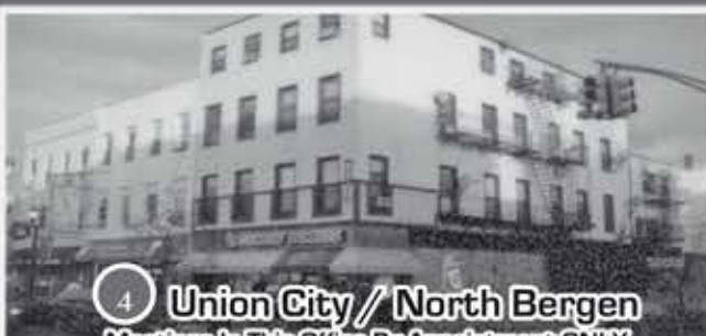
4 Union City / North Bergen Meetings In This Office By Appointment ONLY 418 Monastery Place, Union City, NJ 07087 Tel.: 201-420-0001