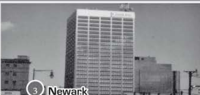
3 Newark One Gateway Center, Suite 2600 - 26th FL., Newark JC NJ 07102 - Tel.: 973-653-3945