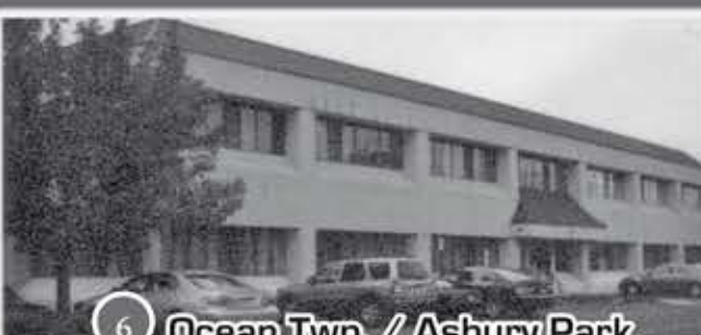
6 Ocean Twp. / Asbury Park 1500 Allaire Ave., Suite 103, Ocean, NJ 07503 Tel.: 732-660-6798