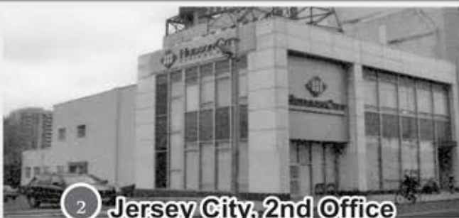
2 Jersey City, 2nd Office 587 Summit Ave., Hudson City Savings Bldg, JC NJ 07306 Tel.: 201-420-0001 / Corner of Summit & Cottage