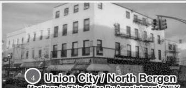
4 Union City / North Bergen Meetings In This Office By Appointment ONLY 418 Monastery Place, Union City, NJ 07087 Tel.: 201-420-0001