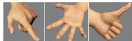
El uso frecuente e inadecuado de las manos para realizar labores manuales es la causa principal.