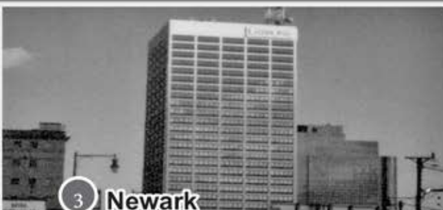
3 Newark One Gateway Center, Suite 2600 - 26th FL., Newark JC NJ 07102 - Tel.: 973-653-3945