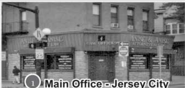
1 Main Office - Jersey City 2974 Kennedy Blvd. Jersey City, NJ 07306 Tel.: 201-420-0001 / Corner of Kennedy & Cottage