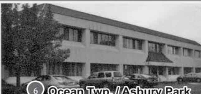
6 Ocean Twp. // Asbury Park 1500 Allaire Ave., Suite 103, Ocean, NJ 07503 Tel.: 732-660-6798