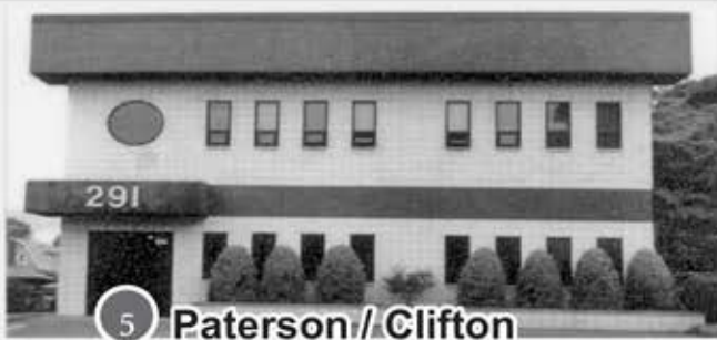
5 Paterson / Clifton 291 Crooks Ave., 2nd FL., Paterson, NJ 07503 Tel.: 973-653-3945