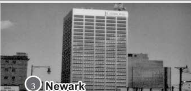
3 Newark One Gateway Center, Suite 2600 - 26th FL., Newark JC NJ 07102 - Tel.: 973-653-3945