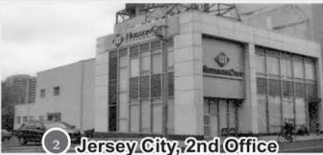
2 Jersey City, 2nd Office 587 Summit Ave., Hudson City Savings Bldg, JC NJ 07306 Tel.: 201-420-0001 / Corner of Summit & Cottage