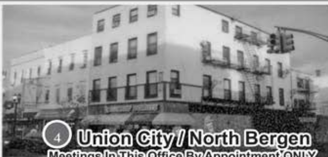
4 Union City / North Bergen Meetings In This Office By Appointment ONLY 418 Monastery Place, Union City, NJ 07087 Tel.: 201-420-0001