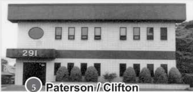
5 Paterson / Clifton 291 Crooks Ave., 2nd FL., Paterson, NJ 07503 Tel.: 973-653-3945