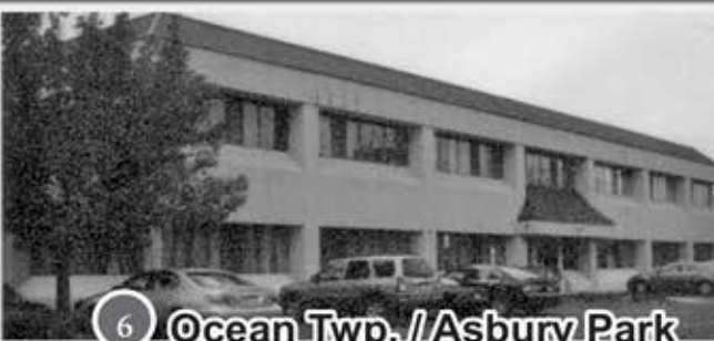
6 Ocean Twp. / Asbury Park 1500 Allaire Ave., Suite 103, Ocean, NJ 07503 Tel.: 732-660-6798