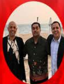
GRUPO TRES X DOS