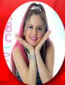
NATY LA ARTISTA DE LOS NIÑOS