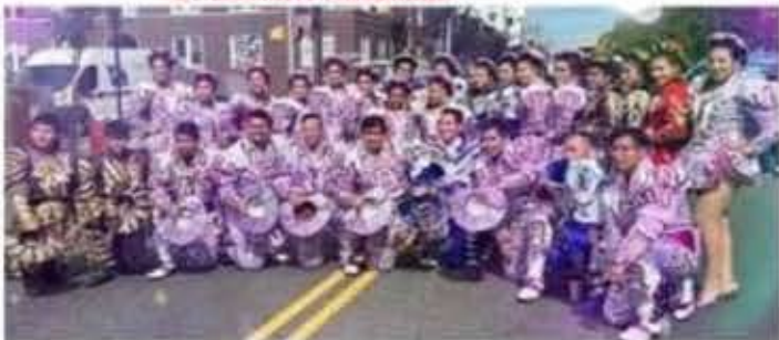
Afovic New Jersey, USA.