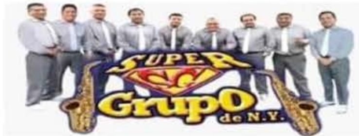
Super Grupo de New York.