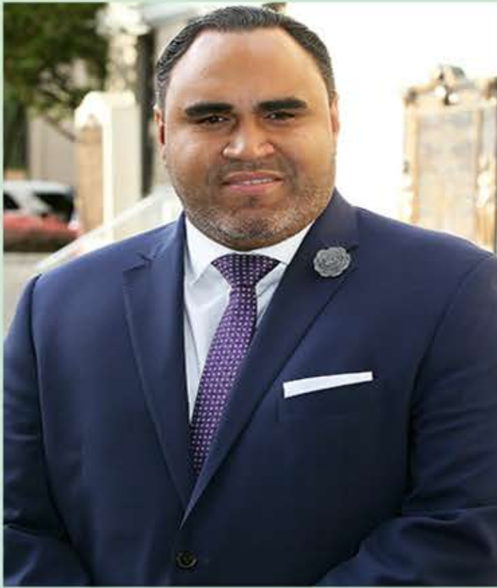
GABRIEL RODRIGUEZ ALCALDE DE WEST NEW YORK y La Junta de Comisionados