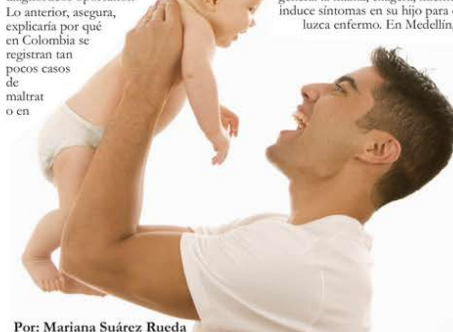
Por: Mariana Suárez Rueda

su accionar tendrá consecuencia en la vida adulta del infante. En el caso de los bebés que son zarandeados, así como puede que no les pase nada, se han visto muchos pequeños que terminan desarrollando problemas neurológicos e, incluso, mueren por el impacto que tiene esa fuerte sacudida en su cerebro. Desafortunadamente, dice Lambert, los pediatras no son conscientes de este tipo de problemáticas y esto impide que se realicen diagnósticos oportunos. Lo anterior, asegura, explicaría por qué en Colombia se registran tan pocos casos de maltrato en