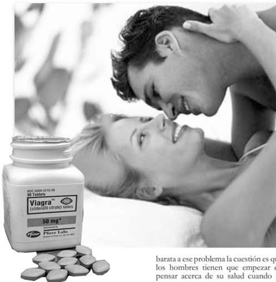
barata a ese problema la cuestión es que los hombres tienen que empezar en pensar acerca de su salud cuando se

V iagra es un fármaco utilizado para dar al impotente hombres una forma de recuperar su normal desempeño en la vida sexual y todos los beneficios que vienen junto con parte de su vida. Se han producido algunos problemas con el uso de este tipo de drogas por el hecho de que a algunas personas les puede causar problemas de corazón y por esa razón muchas personas han experimentado problemas de salud mientras el uso de drogas. También hay un nuevo problema relacionado con viagra porque Algunas personas (gran parte de ellos jóvenes) lo utilizan como drogas recreativas "más probable que se practica entre la comunidad gay y bisexuales" - según el Dr Jeffrey Klausner en su estudio realizado en la ciudad de san Francisco 1 si causan problemas de salud tales Como problemas de corazón, algunas personas incluso hacen una cosa peor por la combinación de la píldora azul con el éxtasis o las anfetaminas tales conductas puede dar lugar a graves problemas, tales como una disminución repentina de la presión arterial. Medicamentos similares se están creando para ayudar a los hombres dándoles una solución más