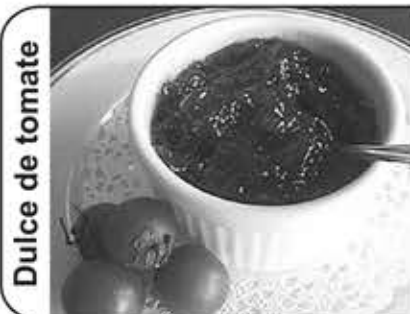
Dulce de tomate

Rallar la cáscara de dos naranjas, exprimirlas y reservarlo todo. En una cazuela al "baño maría" poner los huevos y el azúcar y trabajar a fuego lento hasta que el batidor deje un ligero rastro en la crema, retirar del fuego. Echar la gelatina en el zumo de naranja, dejarla en remojo 5 minutos y disolverla a fuego suave. Cuando la gelatina esté fría, verterla sobre con los huevos en forma de chorrito fino y mezclar. Montar un poco la nata en un cuenco e incorporar poco a poco la mezcla anterior. Dejarlo en un lugar fresco hasta que esté a punto de cuajar, removiéndolo de vez en cuando. Verter en un molde engrasado con un poco de aceite. Guardar en la nevera hasta que cuaje y entonces desmoldarlo y adornarlo a gusto.