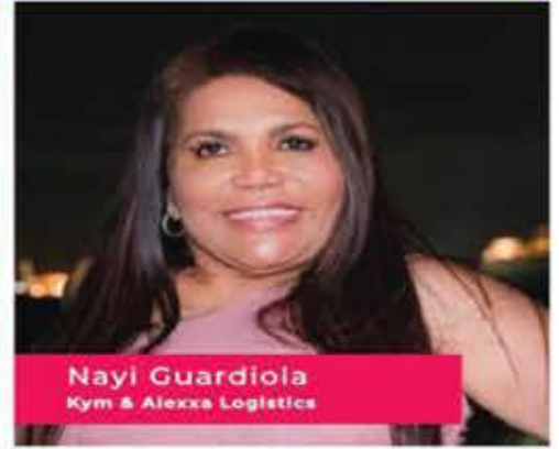
Nayli Guardiola Kym & Alexxa Logistics