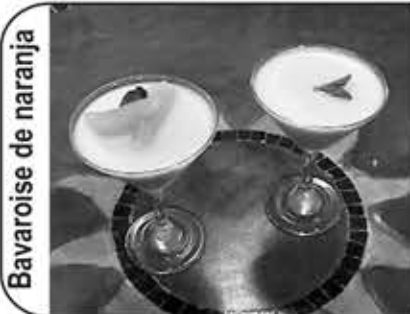
Bavaoise de naranja

Echar el vino en una jarra con el azúcar. Cuando se disuelva el azúcar, echar el zumo de naranja, y añadir los melocotones a trozos. Para que tenga más sabor de melocotón. Un consejo es añadir el melocotón en almíbar. También se puede añadir un licor, como brandy o ron negro. También hay gente que le añade un poco de refresco de naranja. Poner la jarra en la nevera y dejar enfriar. Se debe servir muy fría, y con un poco de hielo. Adornar con las cortezas de limón. Es una bebida suave que debe ser tomada con moderación.