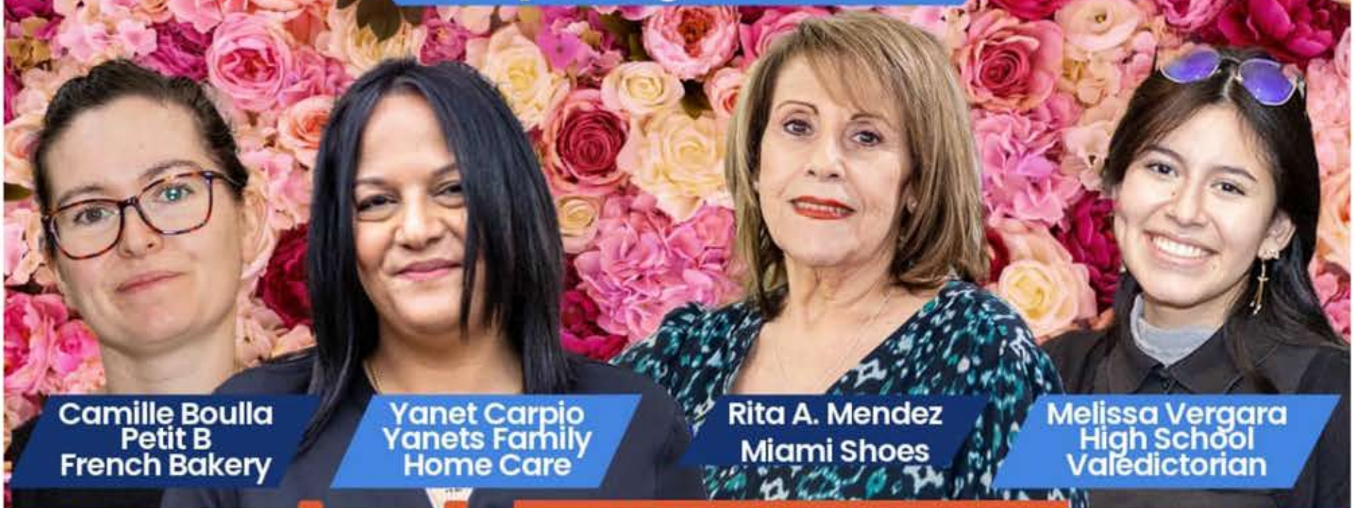
Camille Boulla Petit B French Bakery