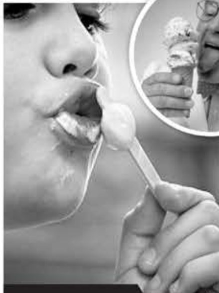
► Probar cientos de helados

Estos trabajos le quitan el sueño a muchos, pero pocos saben que existen realmente y que, más aún, dejan una excelente retribución en dinero a quienes los llevan a cabo. Esta es la lista y lo que ganan quienes tienen los envidiables empleos antes mencionados: