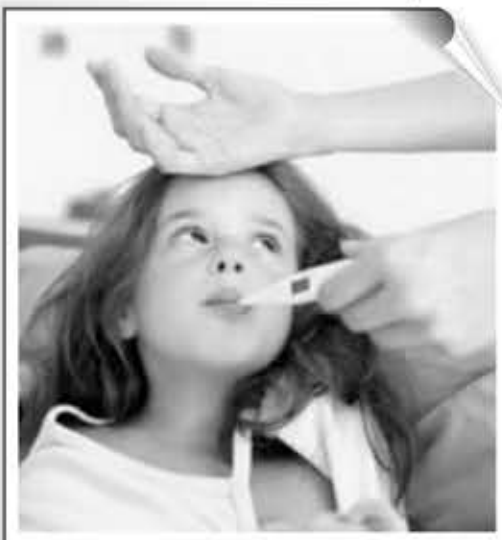
► Vivir de hacerse el enfermo

Cada mañana, miles de niños y jóvenes alrededor del mundo fingen una enfermedad para no tener que ir al colegio. Ahora esas actuaciones -muchas de ellas dignas de un Oscar- tienen una retribución más que aceptable: cerca de 1.440 dólares mensuales.