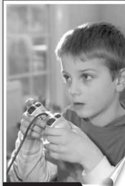
► Jugar todo el día

Otro de los trabajos más deseables es el de 'crítico del aire'. Es el personal de las aerolíneas que trabaja como 'espía', viajando en los aviones de la competencia. Cada vez es más común que las aerolíneas tengan personal capacitado, generalmente ingenieros comerciales del área de marketing, dedicados exclusivamente a volar en las empresas de la competencia. La idea es abordar esos aviones y probar en carne propia el servicio que ofrecen a los pasajeros. De esa manera, pueden estudiar la competencia y tomar de allí las buenas ideas para aplicarlas en su propia aerolínea. Y aunque recibir un sueldo de 2.400 dólares por volar y conocer distintos lugares del mundo puede sonar como el trabajo soñado, los ingenieros se someten a un ritmo duro, en el que muchas veces lo único que ven es el paisaje desde las ventanas del avión. No obstante, no son pocas las ocasiones en que los 'trabajadores turistas' pueden permanecer unos cuantos días en el lugar de destino.