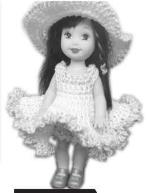
► Vestir muñecas

"La mayor dificultad está en el diseño de la jugabilidad. En hacer que el juego sea original, tenga un control intuitivo y entretenga. Trabajo ocho horas diarias de lunes a viernes, y con horario de entrada y salida flexible", cuenta Santoro, que gana algo más de dos mil dólares al mes por trabajar... jugando.