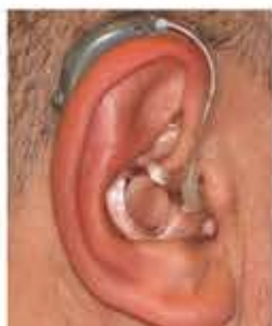
Audifono Retroauricular (BTE=Behind the ear)