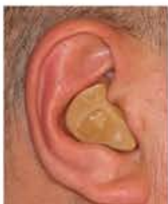
Audifono Intraauricular (ITE=In the ear)