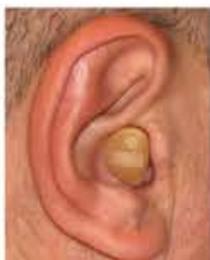
Audifono Intracanal (ITC= In the canal)