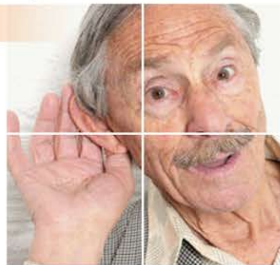
Más del 70% de las personas afectadas por sordera se niegan a usar un audifono por prejuicios sociales y estéticos.

■ Alteraciones internas , manifestadas por cambios bioquímicos vinculados principalmente con los radicales libres, el metabolismo oxidativo de las células y mutaciones mitocondriales adquiridas que contribuyen a un proceso degenerativo donde prácticamente ningún órgano de la economía se salva de presentar alguna alteración. Los cambios degenerativos del oído interno originados por la presbiacusia están caracterizados por una pérdida auditiva bilateral (hipoacusia neurosensorial) particularmente a las frecuencias altas y un deterioro en la discriminación de la palabra (captación de la inteligibilidad de la palabra).