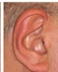
Audifono Oído abierto (RITE=Receiver in the ear)