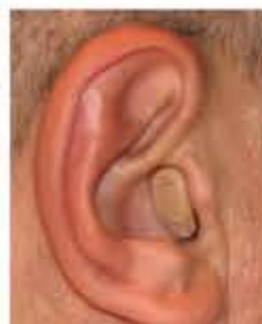
Audifono Intracanal Interno (CIC=Complete in canal)