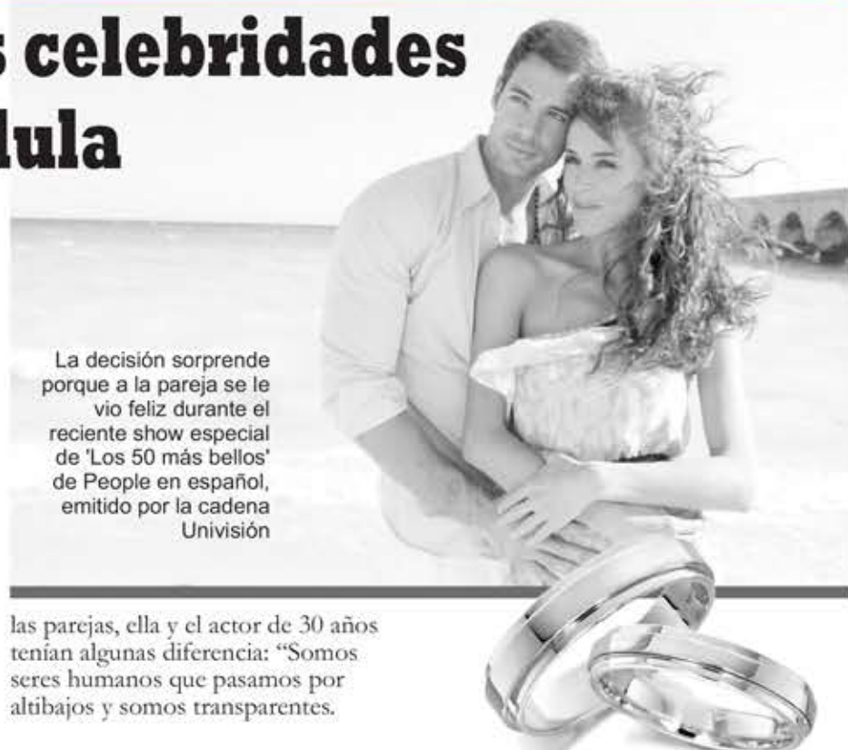
La decisión sorprende porque a la pareja se le vio feliz durante el reciente show especial de 'Los 50 más bellos' de People en español, emitido por la cadena Univisión

las parejas, ella y el actor de 30 años tenían algunas diferencias: "Somos seres humanos que pasamos por altibajos y somos transparentes.